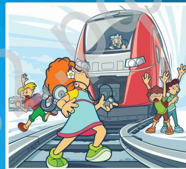
Наушники и железная дорога - не совместимы!