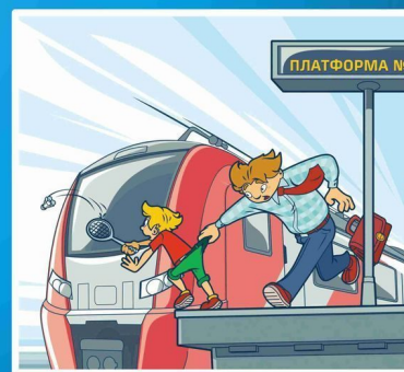
Платформа - не место для игр!

- проезд и переход граждан через железнодорожные пути допускается только в установленных и оборудованных для этого местах;