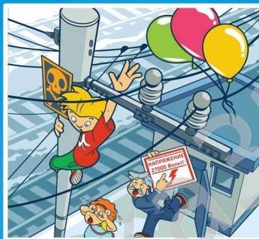
Приближаться к проводам меньше чем за 2 метра - смертельно опасно!