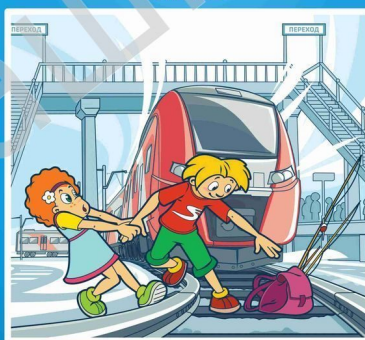
Нельзя переходить пути в неполюженном месте